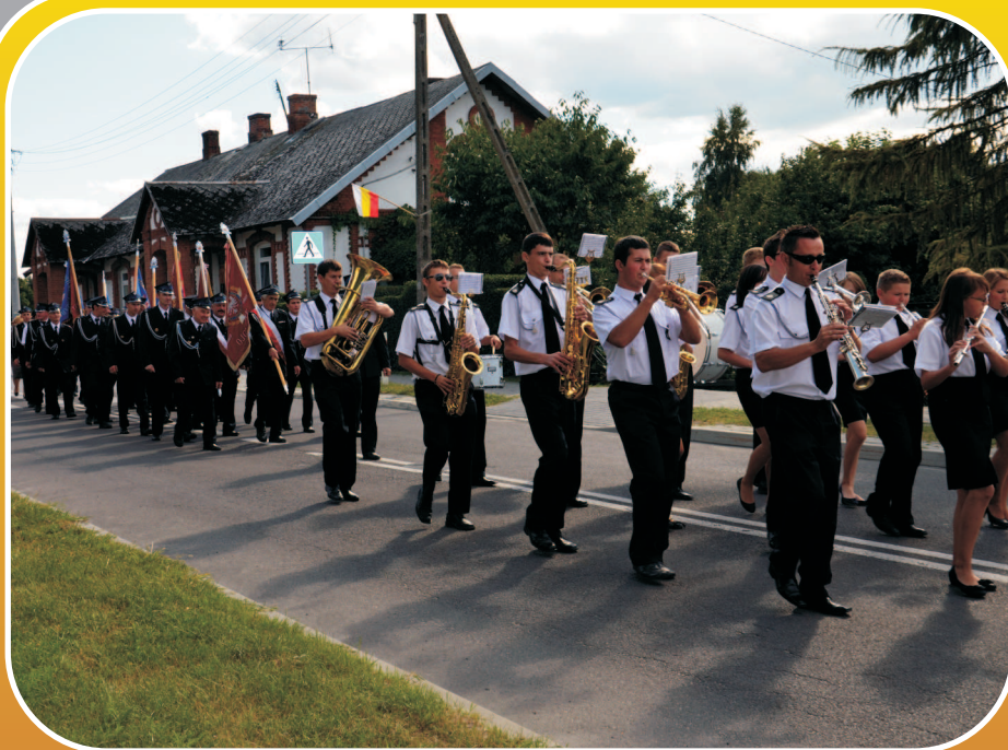
Festiwal Zwyczajów i Obrzędów Ludowych