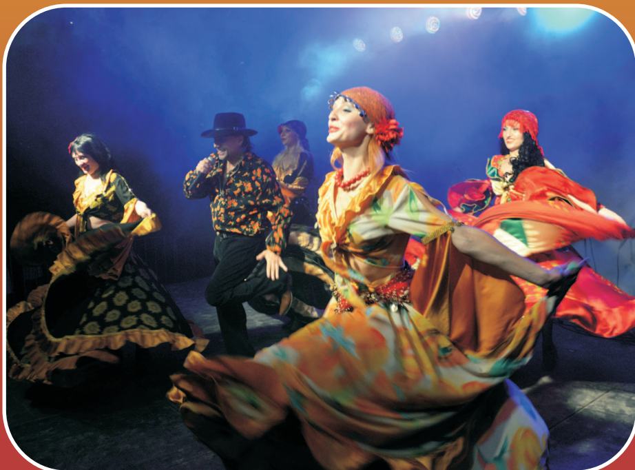
Festiwal Dobrego Humoru