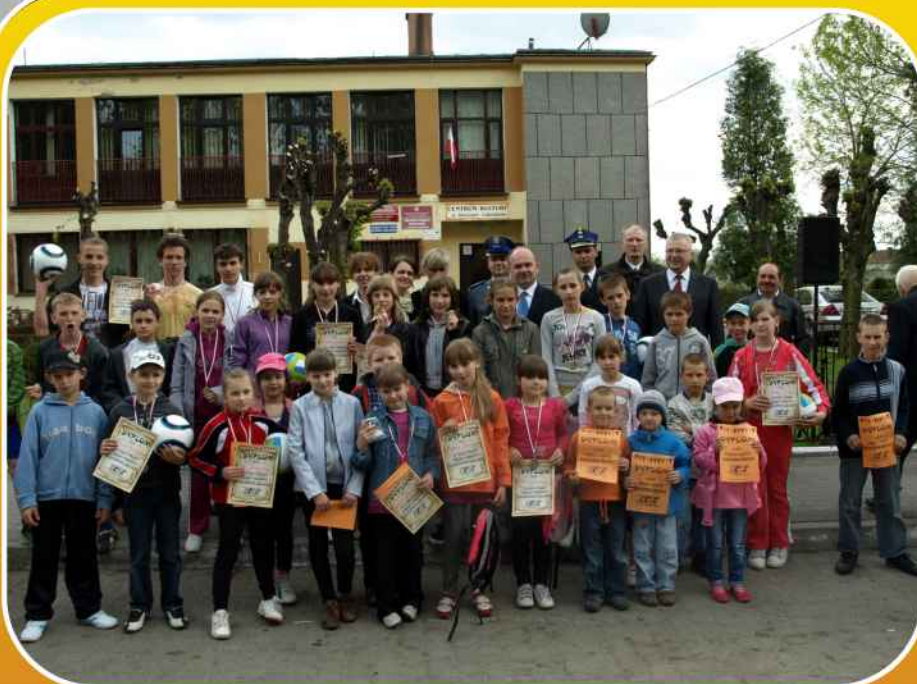
Uczestnicy biegów ulicznych z okazji 3 maja 2011 r.