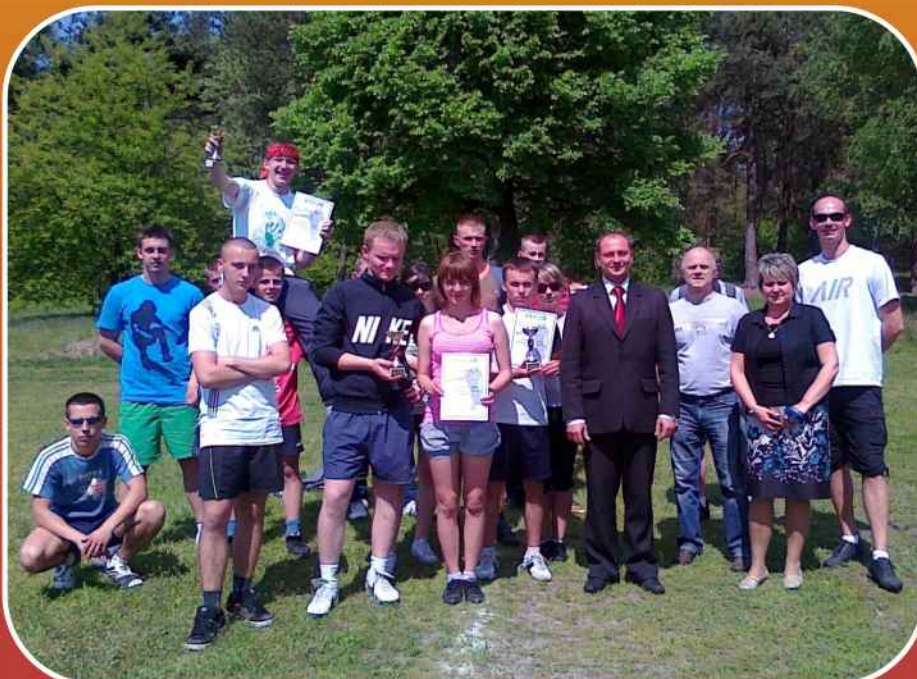
Powiatowa Letnia Spartakiada w sportach obronnych